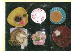
◀行事や季節を楽しむメニューが充実しています。