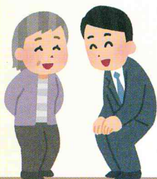
指定介護老人福祉施設 沼ノ端はくちょう苑

● 尊厳を尊重して「穏やかで」「生きがい」を持てる暮らしが継続できるよう支援してまいります。